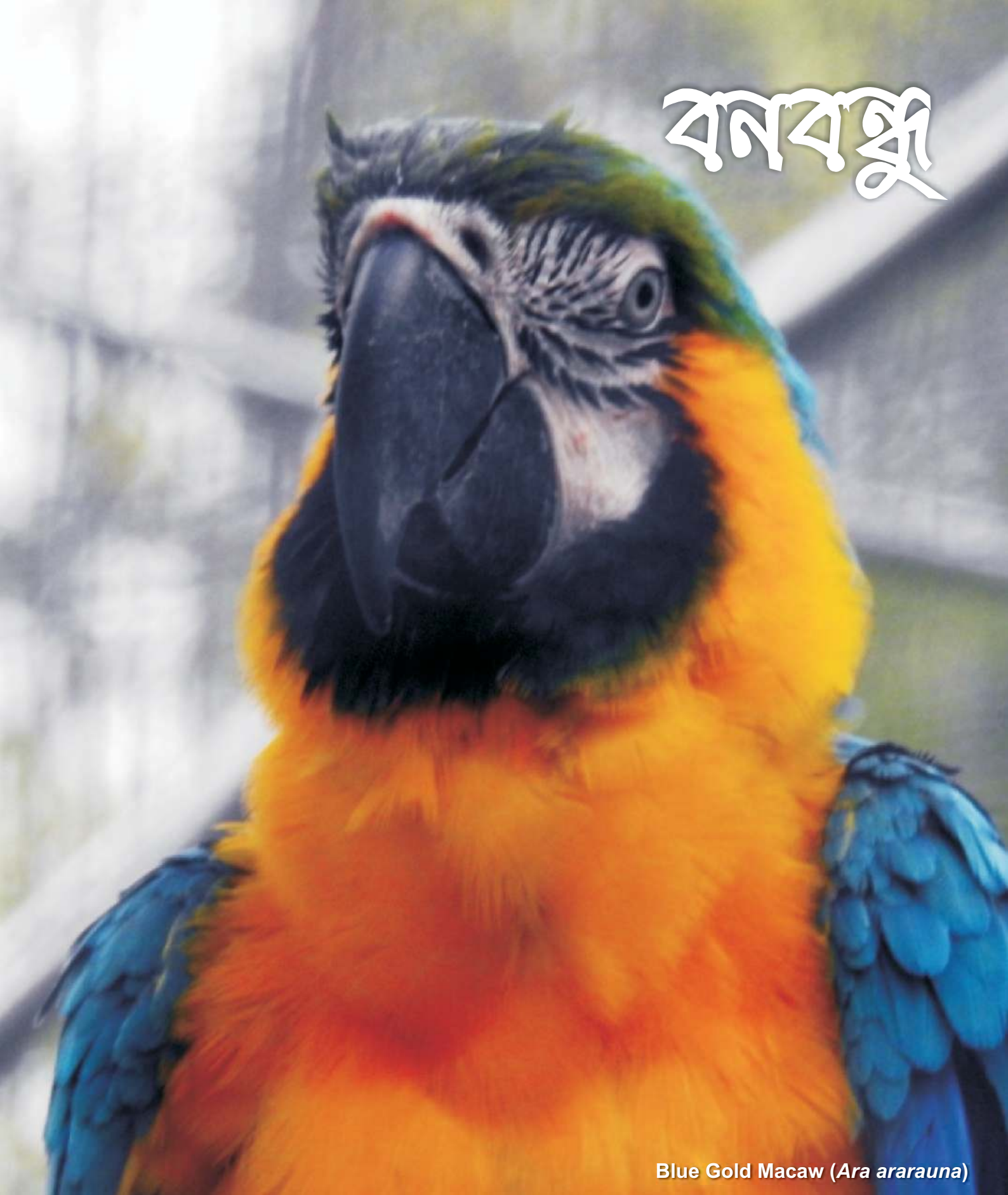
Blue Gold Macaw ( Ara ararauna )